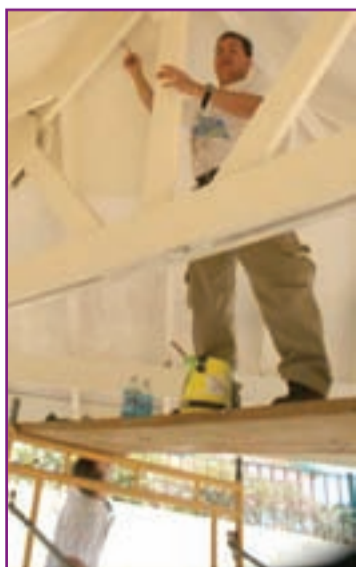
SCOL basico Hilario Angela College na San Nicolas a ricibi

un man di ayudo sumamente necesario for di La Cabana Beach & Racquet Club, ora decenas di empleado di e resort a duna un dia di trabou completo na e scol, cortando matanan, sacando yerbanan indesea, pintando y drechando.